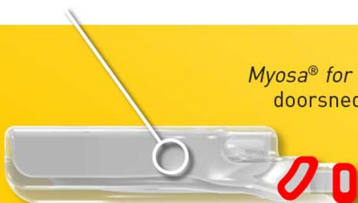
Myosa ® for TMD doorsnede

Harde binnenkant voor een strakke pasvorm.