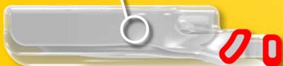
Myosa ® for TMD en coupe

Âme interne rigide pour une bonne tenue.